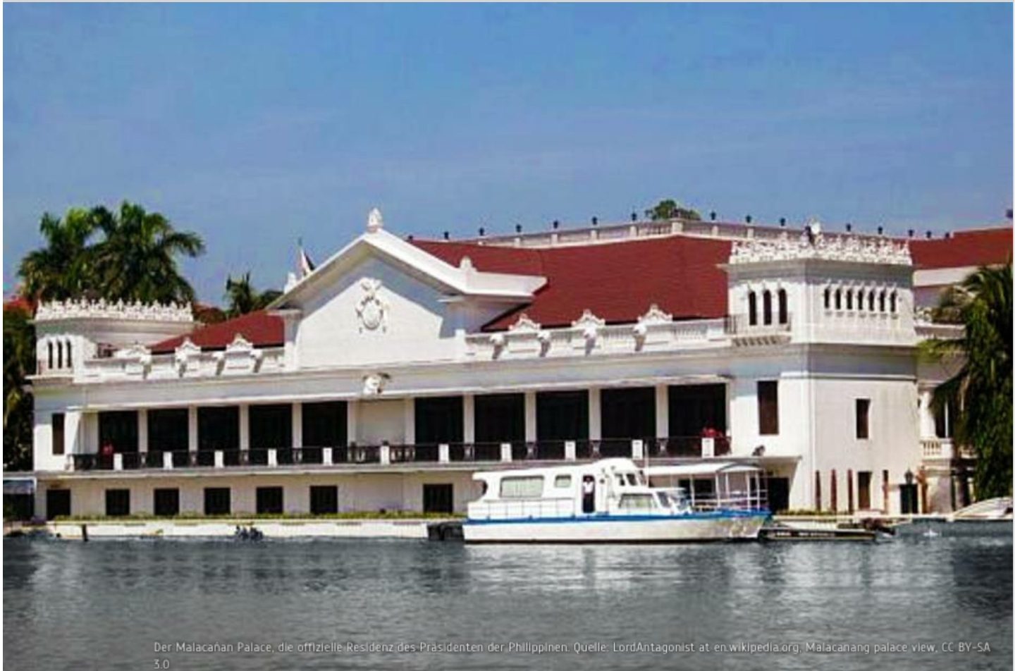
Der Malacañan Palace, die offizielle Residenz des Präsidenten der Philippinen.

Tag der Unabhängigkeit: 12. Juni (1898) / 4. Juli 1946 Staatsoberhaupt: Rodrigo R. Duterte Regierungschef: Rodrigo R. Duterte Politisches System: präsidentielle Demokratie Demokratie Status-Index (BTI): Rang 50 von 129 (2018) Korruptionsindex (CPI): Rang 99 von 180 (2018)